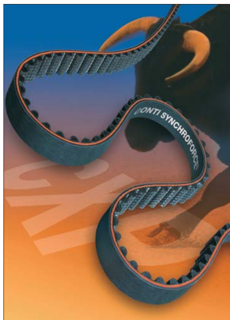
Nejnovější verze hnacích řemenů Conti Synchronforce®

Nová generace Conti® Synchronforce CXP obsahuje nové sklolaminátové tažné vlákno a nový typ tkaniny na zubech. Řemen se vyznačuje dokonalým přenosem výkonu a odolností proti opotřeбенí. Materiálová směs vychází stejně jako u předchozího modelu z polychloroprenového elastomeru. Díky novému adhezivnímu systému je však možné řemen zřetelně více zatížit. S těmito vlastnostmi je Conti® Synchronforce CXP univerzálním řešením problémů pro prakticky všechny rychloběžné pohony – od malých modelů až po vysoce výkonné textilní stroje.